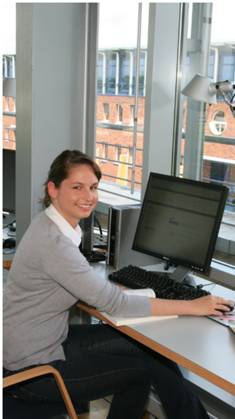
Internetarbeitsplatz in der Bibliothek