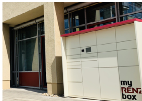
Die myRENZbox vor Gebäude B, unweit des Haupteingangs zur Bibliothek

Unseren beliebten myRENZbox-Service behalten wir bei. Bedeutet: Bücherabholungen und Bücherrückgaben sind weiterhin 24/7 über die Box möglich.